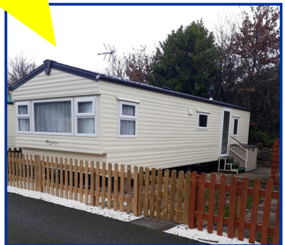
Y garafán yng Nghonwy

Wefan Gwasanaeth Cynnal Gofalwyr neu drwy ffonio ein swyddfa ym Mangor ar 01248 370797.